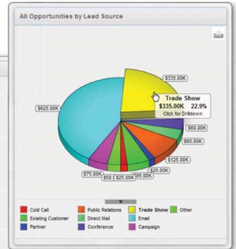
Příležitosti dle zdroje